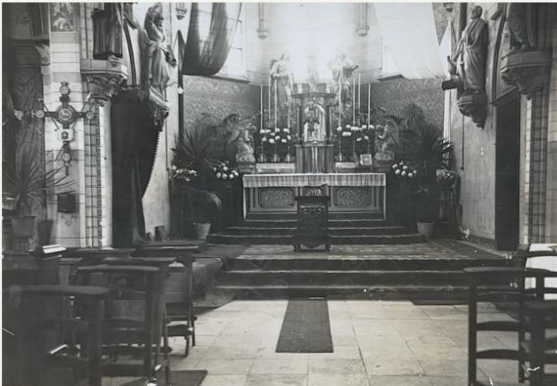
Het prachtig versierde priesterkoor van de oude kerk van Someren-Eind (gesloopt eind jaren '50), speciaal in gereedheid gebracht voor de plechtigheid in 1927.